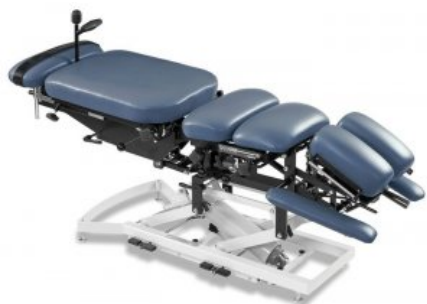
Fig.1: Notre table de flexion-distraction

Mais avant d'entrer dans le vif du sujet, il faut que vous sachiez que j'ai plus de 25 ans d'expérience en pratique et que j'ai une formation universitaire autant en décompression neurovertébrale qu'en technique Cox. De plus, j'utilise la technique Cox depuis des années en clinique, puisque nous avons plusieurs de ces tables de flexion-distraction. J'utilise également plusieurs tables de décompression neurovertébrale depuis plus de 8 ans. Donc, je sais exactement de quoi il en retourne et je n'ai aucune raison de favoriser un traitement plutôt qu'un autre. Mais j'ai horreur des fausses prétentions.