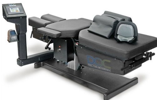
Fig 4: Notre table DOC de décompression neurovertébrale informatisée