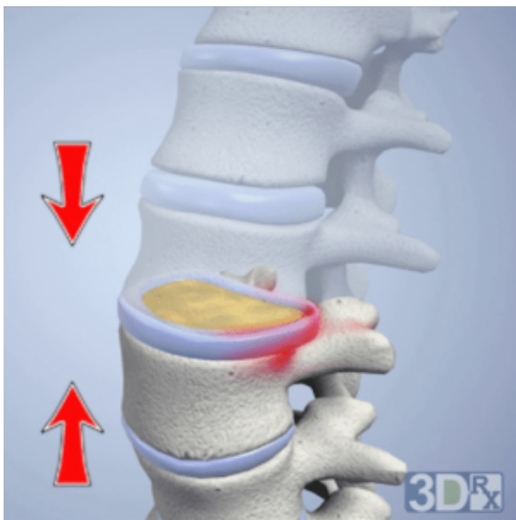
Décompression neurovertébrale et arthrose